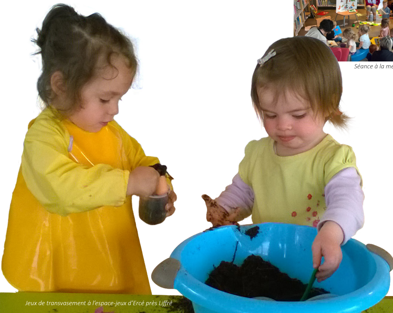
Jeux de transvasement à l'espace-jeux d'Ercé près Liffré