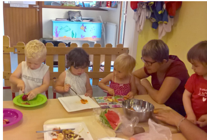
Atelier cuisine à l'espace-jeux de La Bouëxière