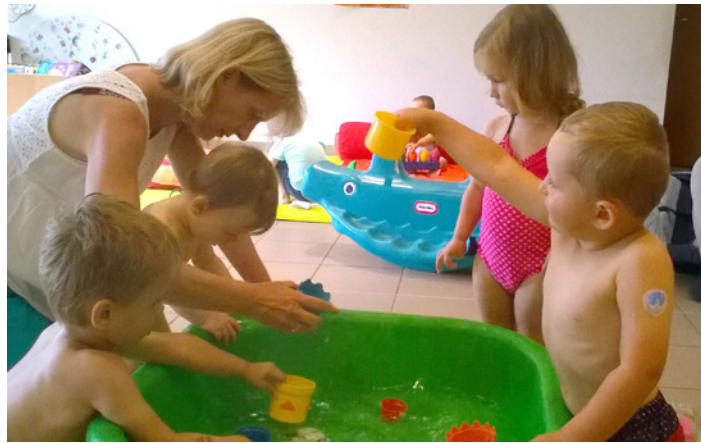
Jeux d'eau à l'espace-jeux de Livré sur Changeon