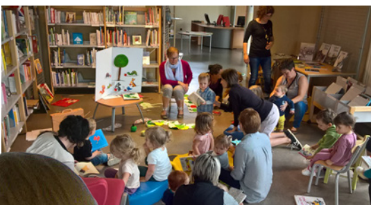
Séance à la médiathèque à l'espace-jeux de Chasné sur Illet