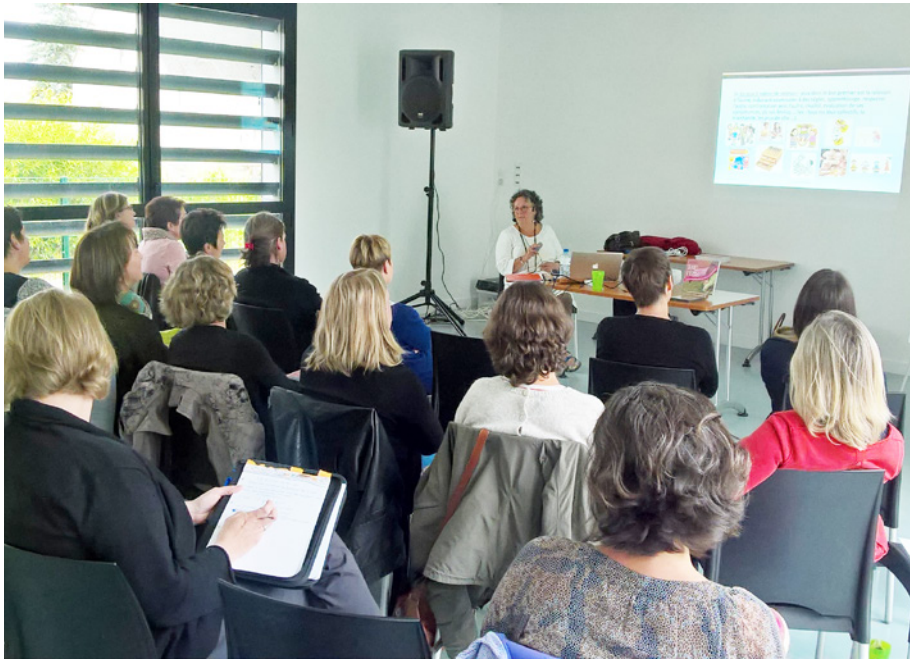
Formation sur l'accompagnement du très jeune enfant dans une motricité libre le 20 mai 2017 - Dourdain