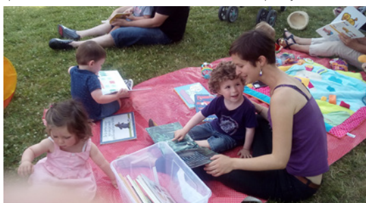
Lecture dans le jardin à l'espace-jeux de Mézières sur Couesnon