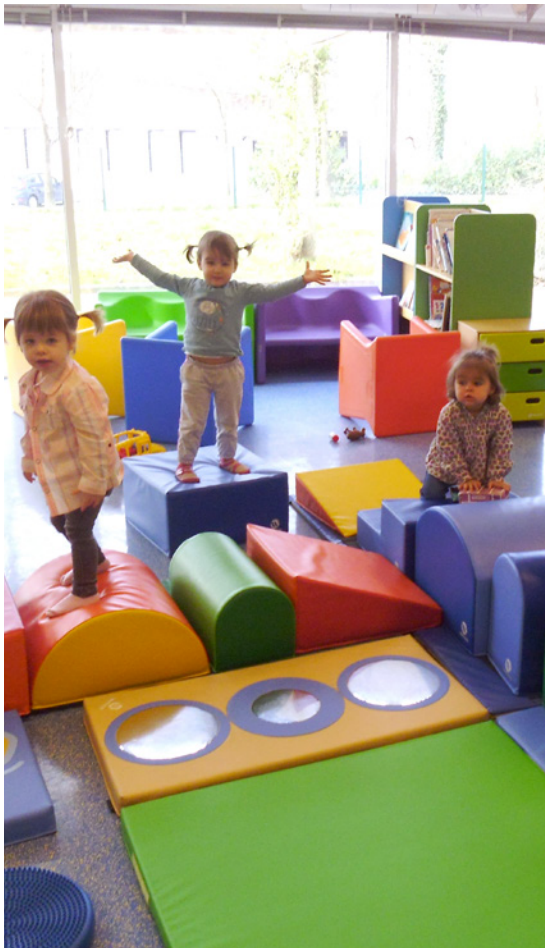
Motoricité à l'espace-jeux de Liffré