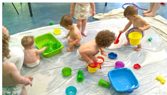
Jeux d'eau à l'espace-jeux de Saint aubin du Cormier

Ils respectent la Charte Qualité élaborée par la CAF et le Conseil Départemental. Il n'est possible de s'y inscrire qu'une fois par semaine. 15 enfants et 10 adultes maximum peuvent y participer, par souci de qualité et de respect des besoins des tout-petits. Une inscription préalable est obligatoire auprès des animatrices.