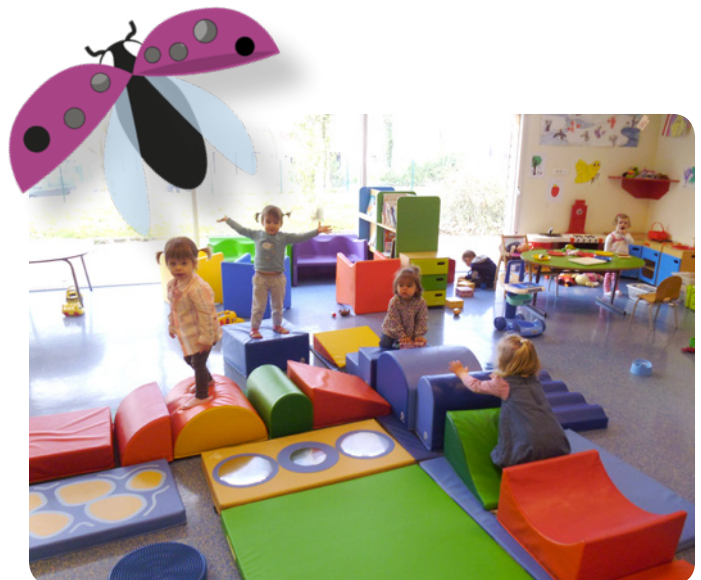
Les espaces jeux, une des grandes missions du RIPAME