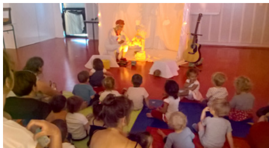
Spectacle Bienvenue à l'anniversaire de Plumette à l'espace-jeux de Dourdain